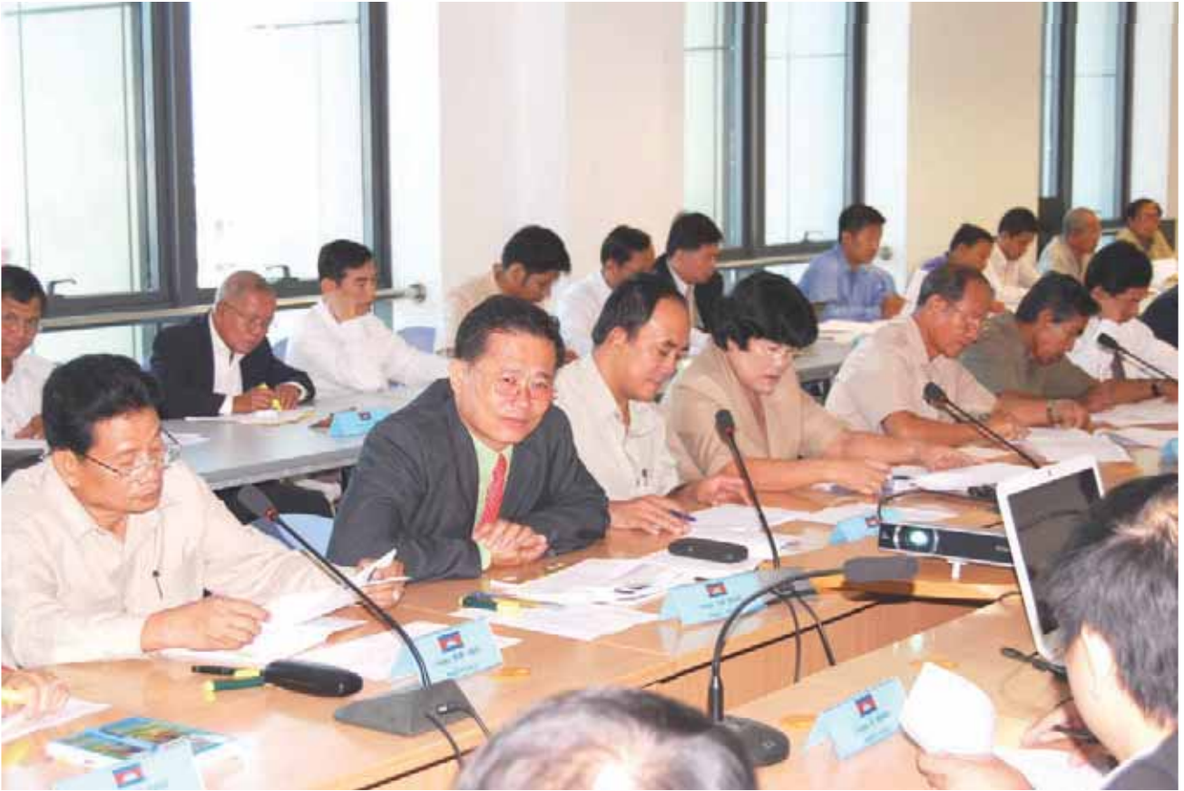
រូបភាពក្នុងកិច្ចប្រជុំ ដើម្បីវិភាគស្ថានភាពសេដ្ឋកិច្ច សង្គមកិច្ច និងវប្បធម៌