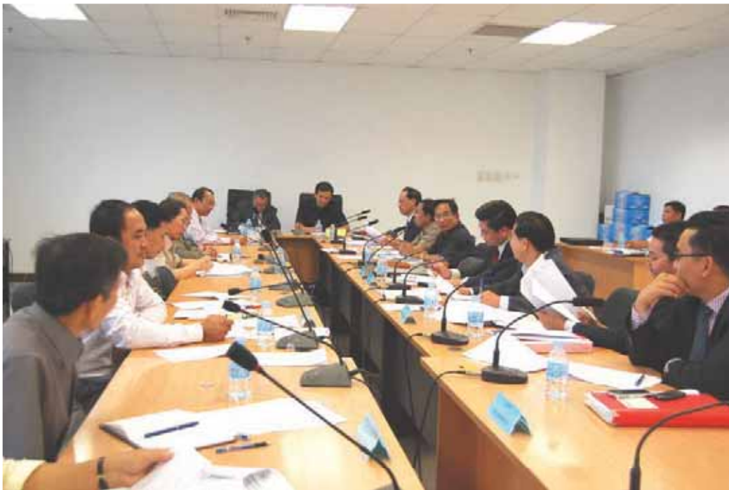
ថែមទៀត។ អង្គប្រជុំទី១បានបញ្ចប់ការពិភាក្សាលើសេចក្តីព្រាងទាំងពីរនេះ។

ធិការរាជរដ្ឋាភិបាល និងមន្ត្រីជំនាញទីស្តីការគណៈរដ្ឋមន្ត្រី។ គួររំលឹកថា សេចក្តីព្រាងព្រះរាជក្រឹត្យស្តីពី របបសន្តិសុខសង្គមសម្រាប់អតីតយុទ្ធជន និងសេចក្តីព្រាងអនុក្រឹត្យស្តីពី ការបង្កើតបេឡាជាតិអតីតយុទ្ធជន បានដាក់ឆ្លងកិច្ចប្រជុំទី១ កាលពីថ្ងៃទី១០ ខែកុម្ភៈ ឆ្នាំ២០១០ ហើយជាលទ្ធផលនាពេលនោះ អង្គប្រជុំបានសម្រេចបង្កើតក្រុមការងារមួយដែលមានសមាសភាព ECOSOCC ក្រុមប្រឹក្សាអ្នកច្បាប់ និងតំណាងក្រសួងសាមី ដើម្បីរៀបចំកែសម្រួលសេចក្តីព្រាងនេះឡើងវិញ។ អង្គប្រជុំបានពិភាក្សាគ្នាយ៉ាងផុលផុសលើសេចក្តីព្រាងកែសម្រួលថ្មីនេះ ហើយបានសម្រេចធ្វើការកែសម្រួលខ្លឹមសារពាក្យពេចន៍ខ្លះៗ ដើម្បីធ្វើឲ្យសេចក្តីព្រាងនេះ កាន់តែល្អប្រសើរ